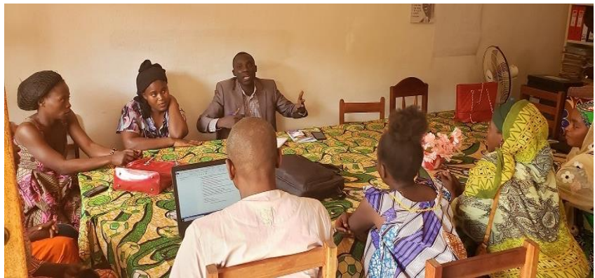
Photo 2 : Entretien avec un groupe mixte (Hommefemmes) par les consultants à Bangui

81. En impliquant les hommes comme des partenaires dans le processus de promotion de la paix et réconciliation, le projet a promu la résolution des causes des inégalités de genre. En plus, la situation des femmes et des groupes marginalisés notamment enfants et personnes âgées, a été abordée lors des travaux de groupes durant les sessions de formations pour permettre aux bénéficiaires eux-mêmes de se rendre compte de ces inégalités et de changer de comportement. L'aspect genre a été aussi respecté avec l'implication des leaders communautaires pour ce qui concerne le partage des rôles et responsabilités. Les activités de formation ne distinguent pas les groupes religieux chrétiens, musulmans ou peulhs. A Bambari par exemple, tous les groupes religieux participent librement aux réunions avec leurs membres notamment dans les Clubs Dimitra une fois par semaine.